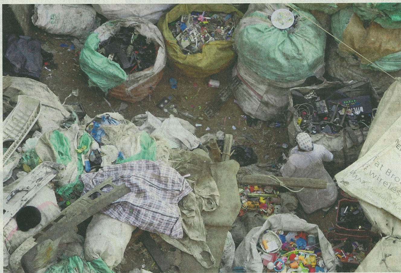
Bei den Kairoer Zabalin, die vom Müllsammeln leben: Der Reiseleiter riet vom Besuch ab. Zu Unrecht.

Tagsüber hält man an kleineren Tempeln, die vor dem Bau des Staudamms versetzt wurden und die bei aller Schönheit doch nur den Auftakt bilden zum Weltwunder von Abu Simbel. Das hat 1813 der Schweizer Jean Louis Burckhardt aus seinem 3000-jährigen Dornröschenschlaf geweckt (allerdings eher eine Sand- als eine Dornenhecke) und deutsche Ingenieurskunst 1963-1968 vor den Fluten des Nassersees gerettet: in Blöcke zersägt, 180 Meter landeinwärts und 65 Meter hochgehievt und dort, gestützt von Betonkuppeln, wieder exakt zusammengesetzt.